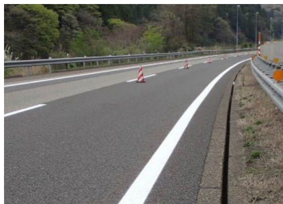
《路面標示工の施工》