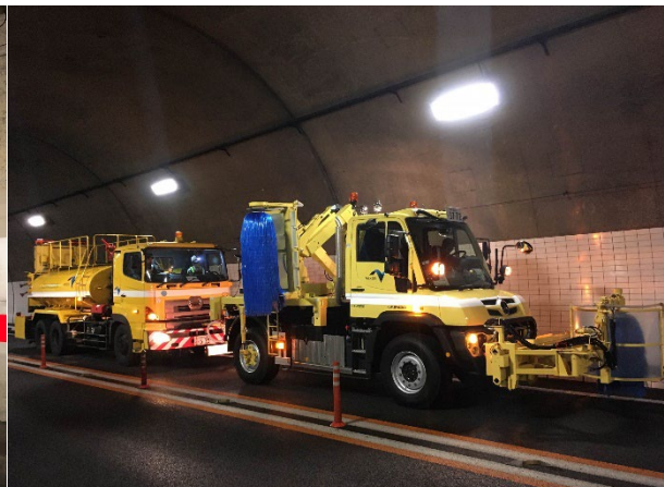
《トンネル側壁清掃》