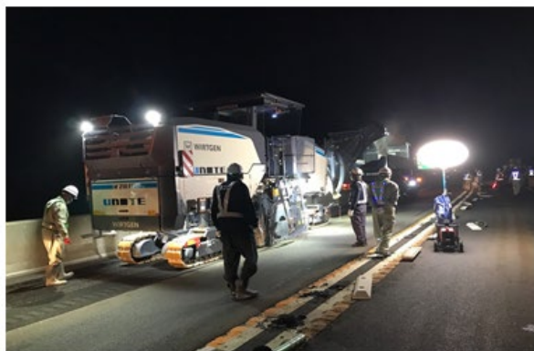
《傷んだ舗装撤去状況》

橋梁の床版※に雨水などが浸透すると床版の耐荷力や耐久性に悪影響を及ぼすため、浸透しないよう防水層を設けています。舗装損傷（ポットホールなど）に伴い防水層も損傷しているため、損傷した防水層の再施工をおこないます。