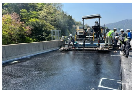
《床版防水工施工状況》