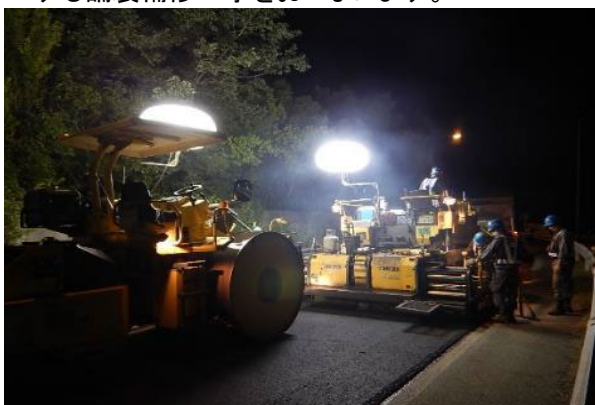
《路面損傷箇所の補修》

走行安全性・快適性の確保のため、舗装面のひび割れや段差などが顕著に発生している箇所を修復する舗装補修工事をおこないます。