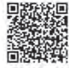
トラック運送業界の過労死等防止計画