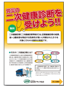
労災の二次健康診断を受けよう!!

*脳・心臓疾患に関連する4項目について異常の所見があるときは、無料で「労災二次健康診断」を利用しましょう。