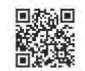
運輸ヘルスケアナビシステム®

*健康診断の事後措置を支援する「運輸ヘルスケアナビシステム®」を活用するなど、体制を整備しましょう。