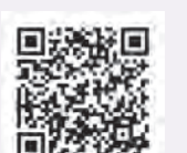
過労死等・健康起因事故防止特設ページ