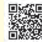
全ト協助成制度ページ

全日本トラック協会では、過労死や健康起因事故につながる、脳・心臓疾患発症の要因となる高血圧の予防には血圧測定が重要であることから、血圧計の普及を図るため、乗務前点呼における血圧測定に活用できる高機能な血圧計の導入助成事業を各都道府県トラック協会を通じて実施いたしますので、お申し込み等詳細につきましては、所属のトラック協会にお問い合わせください。