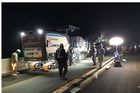
《傷んだ舗装撤去状況》

橋梁の床版※に雨水などが浸透することを防ぐため、防水層を設けています。舗装損傷（ポットホールなど）に伴い防水層も損傷しているため、損傷した防水層の再施工をおこないます。