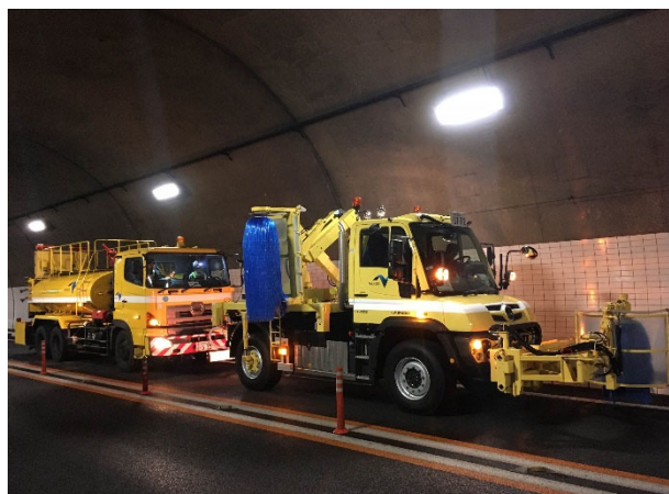
《トンネル側壁清掃》