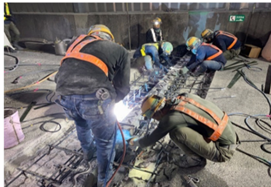
《伸縮装置取替施工状況》