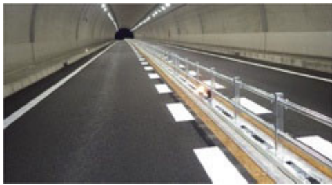
《センターパイプ設置の例》

重大事故につながりやすい暫定 2 車線区間での高速道路の正面衝突事故防止対策として、ラバーポールに代えて区画柵(センターパイプ、センターブロック)の試行設置箇所の拡大をおこないます。