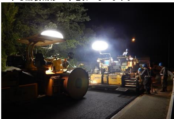
《路面損傷箇所の補修》

走行安全性・快適性の確保のため、舗装面のひび割れや段差などが顕著に発生している箇所を修復する舗装補修工事をおこないます。