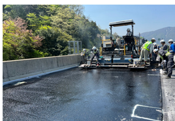
《床版防水工施工状況》