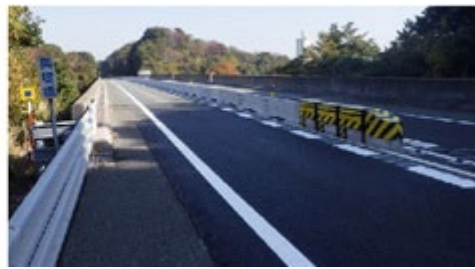
《センターブロック設置の例》