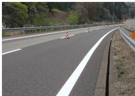
《路面標示工の施工》